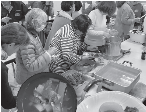
試食会では野菜本来の美味しさを楽しみました

『やさいBOX』は、何が届くか分からぬおまかせのセット野菜です。組合員が利用しやすい価格を実現するために、生産者と生活クラブが綿密に計画を立てています。1年間を通じて栽培する野菜の種類や収穫量を計画的に調整し、生活クラブが全量を買収する仕組みです。曲がった野菜や虫食いの野菜も受け入れることで、生産者は安定して野菜の栽培を続けることができます。また、野菜の